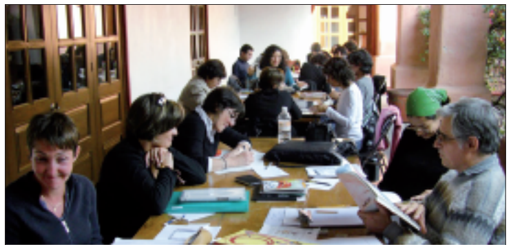
Corso di illustrazione tenuto da Kveta Pacovska presso l'IC di Città del Messico

La mostra è stata promossa e organizzata dall'Associazione Culturale Teatrio di Venezia, con il contributo della Provincia di Roma, Assessorato alle Politiche Culturali, in collaborazione con la Fondazione Musica per Roma e con il patrocinio dell'Istituto Culturale Ceco. L'omaggio all'artista comprende un'ampia carrellata di disegni e sculture.