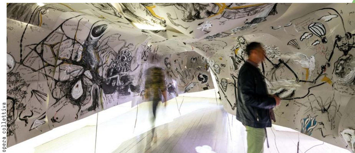
Work: opera collettiva

Il diplomato in Scultura e installazione potrà dedicarsi all'attività di artista, così come alle molte professioni creative legate al mondo dell'arte: designer di spazi, mostre e allestimenti, assistente in galleria, collaboratore nei musei d'arte contemporanea, assistente curatoriale, collaboratore negli studi di architettura, organizzatore di eventi.