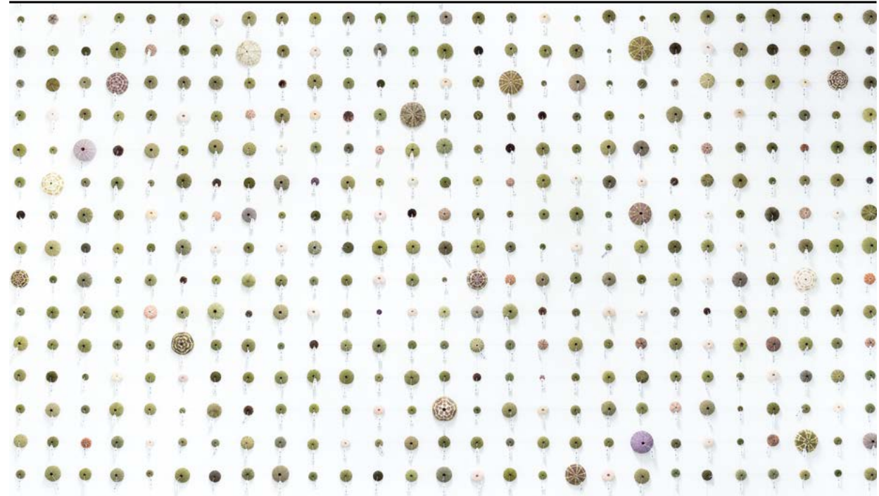
Work: Camilla Guccione