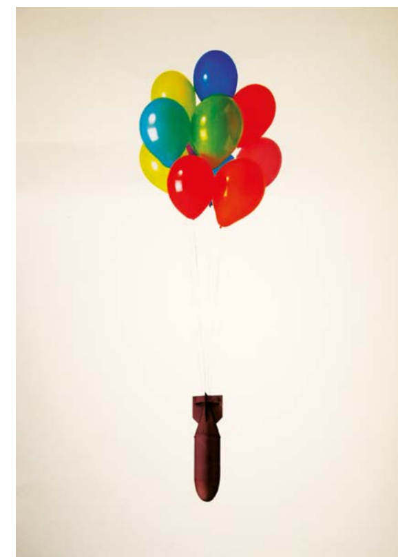
Work: Amedeo Longo

A variety of essential history and critical thinking subjects complete the education provided by our Bachelor of Arts, in addition to many events with contemporary art key players. Students will also be involved in internships, workshops, advanced training courses and talks.