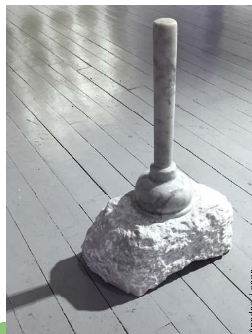
Work: Amedeo Longo

Sculpture is the quintessential environmental art since it must deal directly with materials. From the oldest to the newest results of the most advanced scientific and technological inventions, it is the substance of which things are made of: stones and metals, natural and synthetic fibers, air and water, earth and fire, materials that have yet to come and those that have still to be invented. The artist transforms space and matter