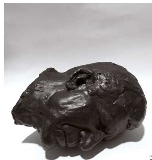
Work: Davide Micelli

Deve saper organizzare, curare e presentare il suo lavoro, oltre a saper parlare e scrivere in inglese. Per questo nel nostro triennio una serie di materie storiche e teoriche fondamentali completano la formazione, insieme a un nutrito calendario di appuntamenti con i protagonisti del mondo dell'arte contemporanea: tirocini, workshop, corsi di alta formazione, studio visit e talk, completano il percorso di formazione durante il triennio.