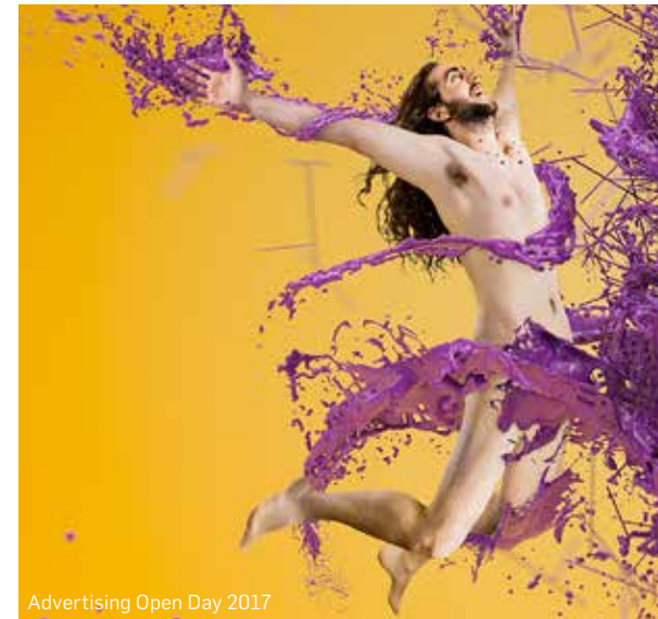
Advertising Open Day 2017

The course also provides essential knowledge for the management of the entire creative project (design, contents, deadline management, division of roles) that is vital for the insertion in the creative Industry.