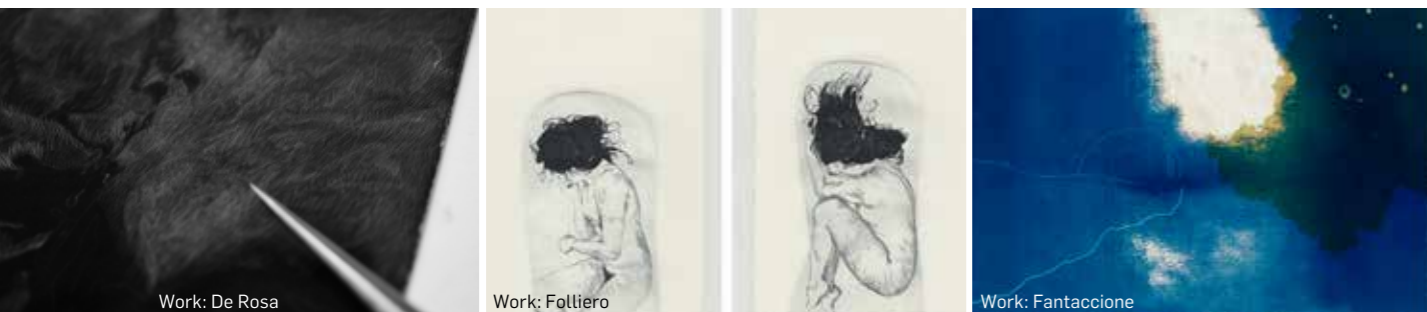
Work: De Rosa

Publishing, graphics, photography, communication, catalogue and art book production, multimedia installation design, artistic and conceptual direction, competence in painting, sculpture and decorating: these and many other areas are possible fields of work for the graduate of Graphic arts at RUFA; an artist and a professional, who is rich in talent and manual skills, able to put his knowledge to work at the service of every aspect of art, communication, and publishing.