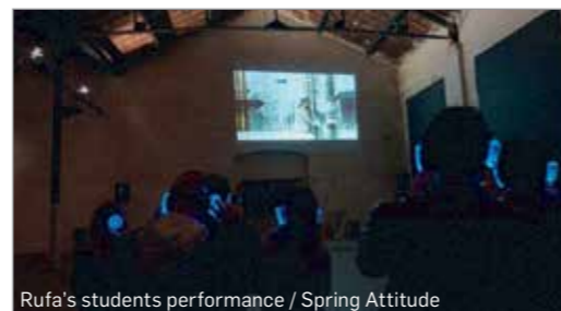
Rufa's students performance / Spring Attitude