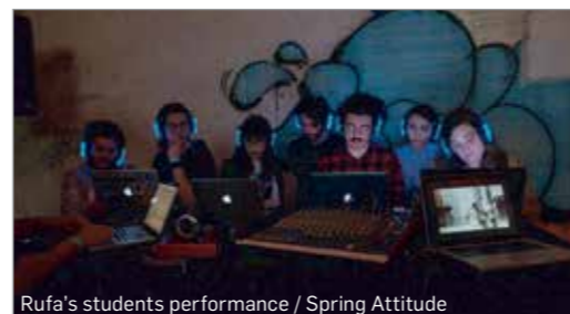
Rufa's students performance / Spring Attitude