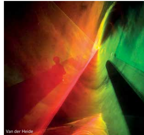
Van der Heide

Within the process of designing constructed spaces, both indoor and outdoor, the Course in Multimedia arts and design gives participants the tools they will need to identify the role of multimedia in relation to the particular functional requirements and environmental conditions of each project. Students acquire the mastery of the necessary technical solutions and methodological procedures to design installations, spaces and multimedia fittings, interactive sound environments, audiovisual performances, virtual sets and videomapping.