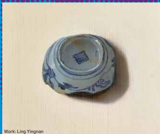
Work: Ling Yingnan