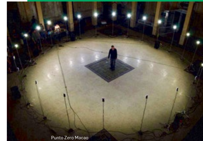
Punto Zero Macao

Accompanied and supported by their tutors, the two-year course students are given valuable opportunities to participate in studios, training workshops, master classes, interdisciplinary projects and competitions, as well as in internships (also post-graduate), in companies and public institutions in order to learn the profession in the field. They will also have the possibility to participate in Erasmus+, the EU programme which offers students a period of studies abroad or an internship in another Partner University and/or a mobility programme for internships in a foreign working reality.