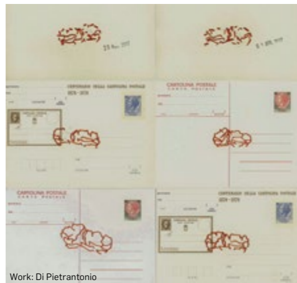
Work: Di Pietrantonio

Da sempre centro creativo di eccellenza, dal respiro internazionale, e aperta alle contaminazioni provenienti da tutti gli ambiti artistici e culturali, RUFA offre una formazione specialistica per i professionisti di oggi e di domani. La ricchezza degli insegnamenti di ogni corso permette agli studenti di acquisire conoscenze e competenze spendibili nell'industria della creatività.