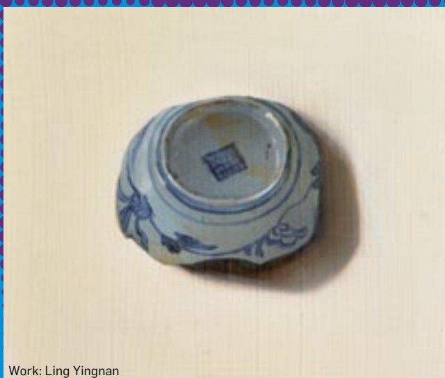
Work: Ling Yingnan