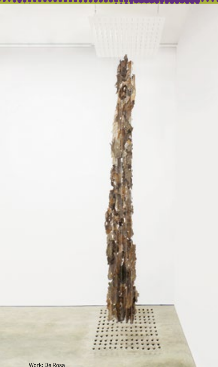
Work: De Rosa