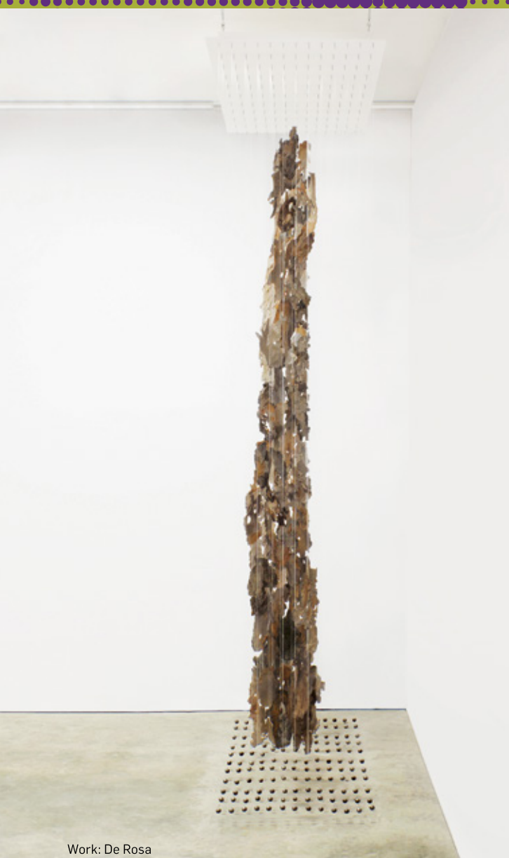
Work: De Rosa