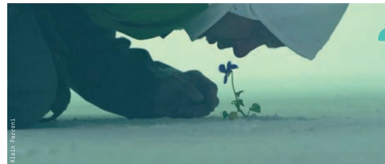
Work: Alain Parconni

Cinema graduates will be capable of working in the many creative professional fields related to the cinema and TV series industry as: directors and editors, cinematographers, script-writers, sound technicians, production assistants. They will also be capable of creating content for the audiovisual and advertising industry, to work as an assistants and associates in festivals and museums and as event organizers.