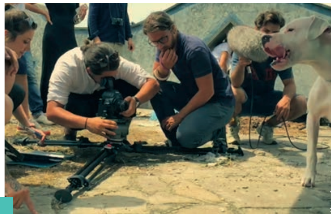
Work: Alain Parconni

Studying Cinema through our Bachelor of Arts means all of this. It means studying in Rome, the city where a new and flourishing audiovisual industry has developed and is in constant transformation. But first of all it means possessing the necessary technical knowledge to work with motion pictures: learning basic filmmaking techniques, the art of directing and of directing actors, film shooting and editing techniques, lighting systems and sound technology, cinematography and to learn and live on set. But it also means learning creative writing skills, the mechanisms behind production and distribution and the different sectors of the visual industry, from cinema, to television, to the web. It means learning about the history of cinema and video, as well as about aesthetics intended as phenomenology of images. Nowadays those who want to work in the audiovisual industry must learn about the communication sector, know how to work in a team, how to organize and promote their work, also by making a pitch. They must be capable of speaking and writing in English. For this reason a variety of essential history and critical thinking subjects complete the education provided by our Bachelor of Arts, in addition to many events with film and contemporary art key players. Students will also be involved in internships, workshops, advanced training courses and talks.