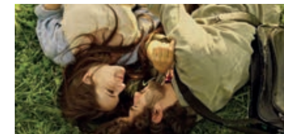
Work: Cristiana Gangale