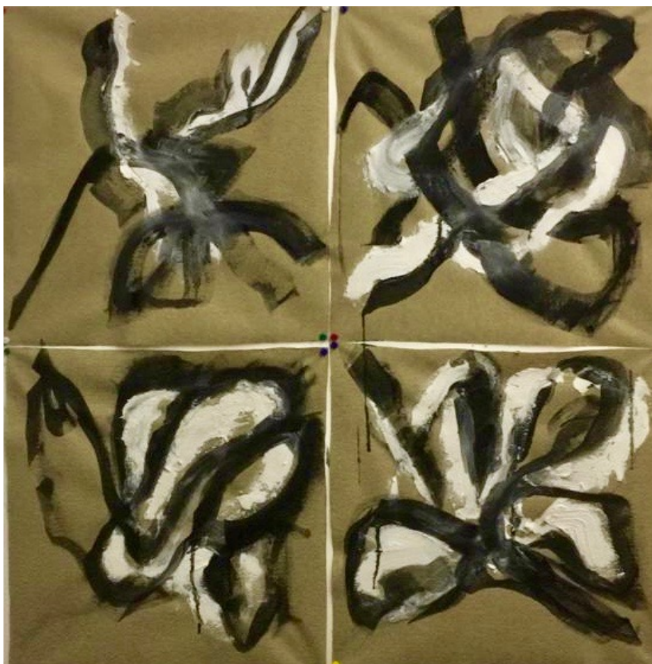
“SENZA TITOLO” Acrilico e gesso su tela Roma, 2020