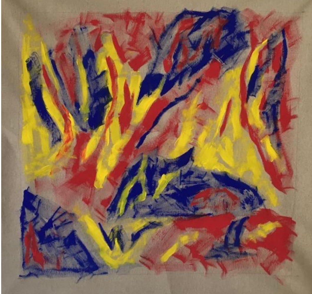
"SENZA TITOLO" Colori vinilici su tela, 100x100cm Roma, 2020