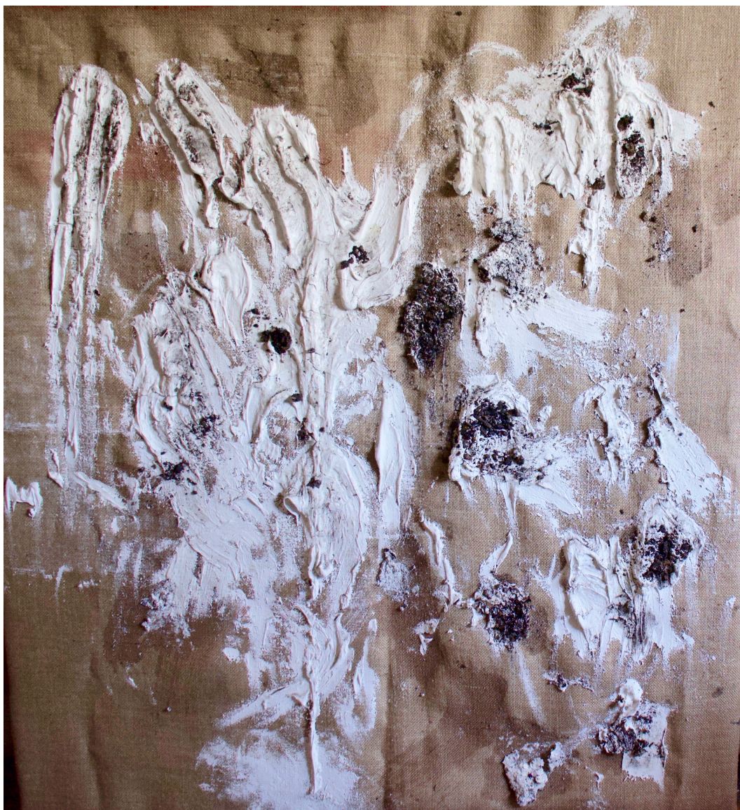
“SCATURIRE DAL TERRENO, SOSTENERSI TRA IL CEMENTO, SOCCOMBERE NEL TERRENO” Stucco e terreno su Juta, 100x100cm Roma, 2019