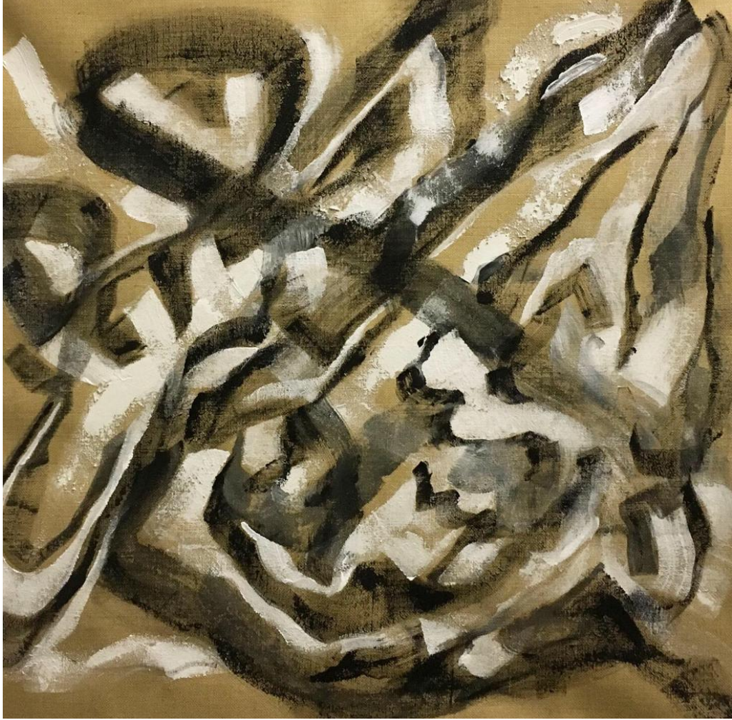
"SENZA TITOLO" Acrilico su juta, 100x100cm Roma, 2020