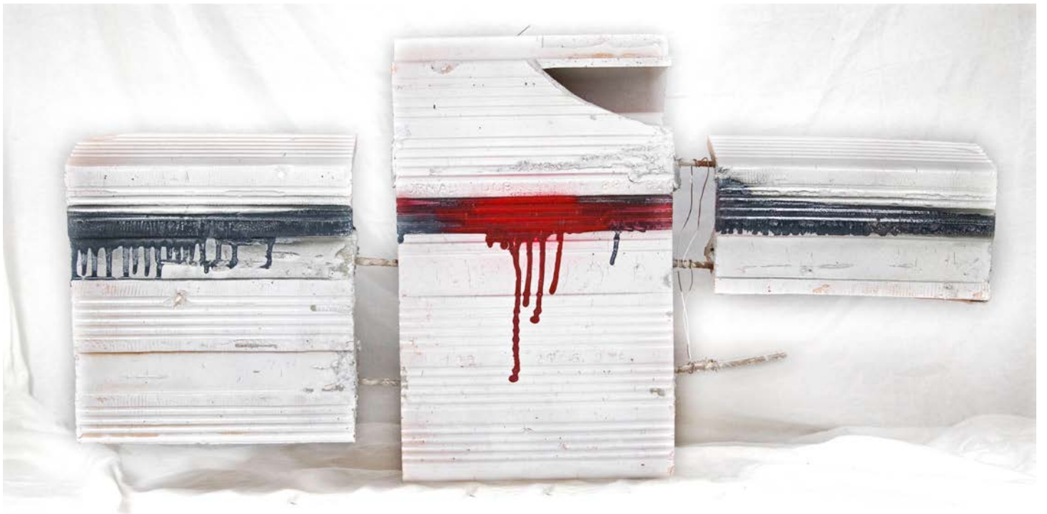
Terracotta, spray,ferro , 2019