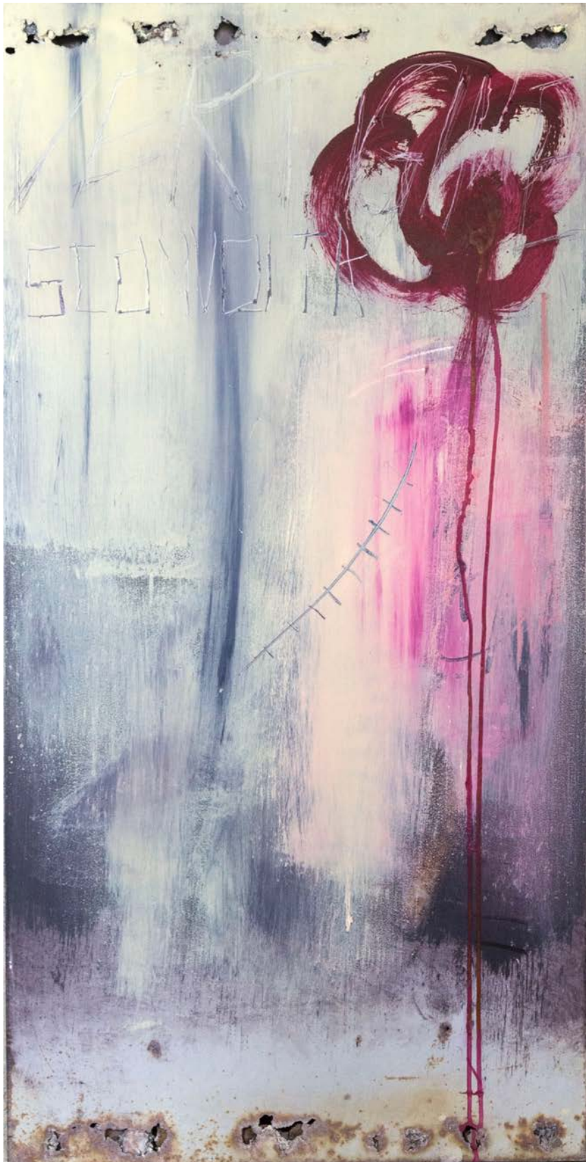
"Untitled" Vernici industriali, acrilico, olio su ferro , 60x120x3 cm , Roma 2020