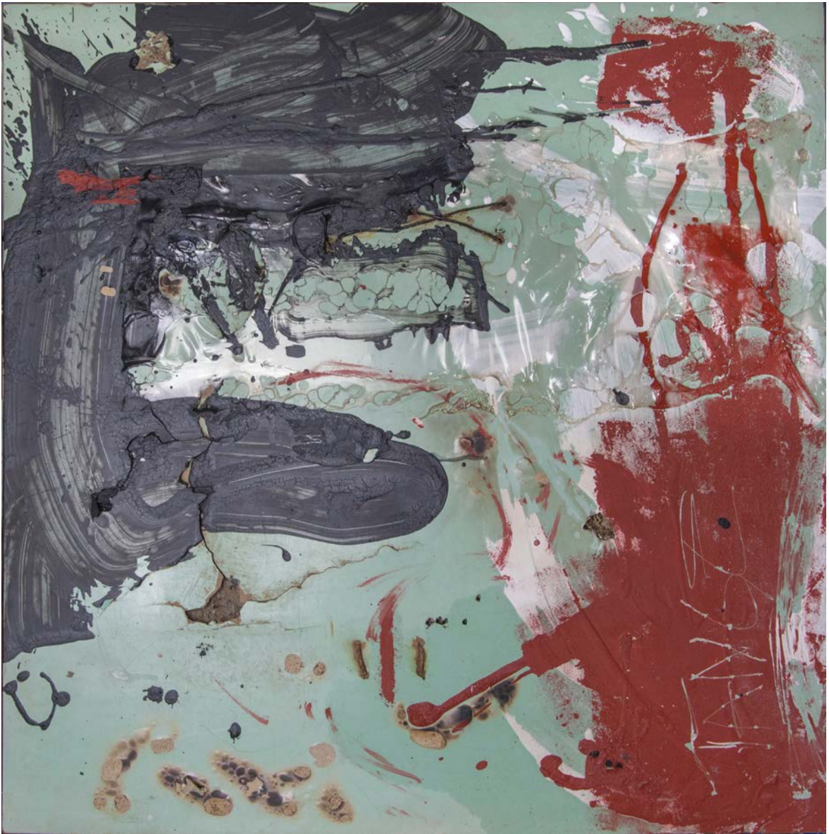
"Untitled" Vernice industriale, plastica e combustioni su formica , 80x80x2 cm , Roma 2020