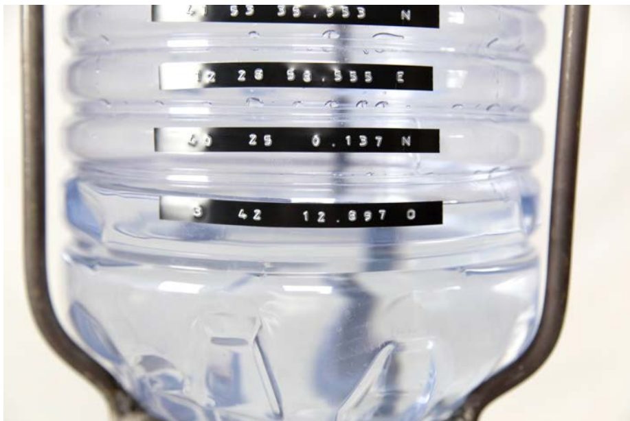
Acciaio, acqua , plastica + video proiezione , 2020 Vimeo : https://vimeo.com/387162572 P: waterproof