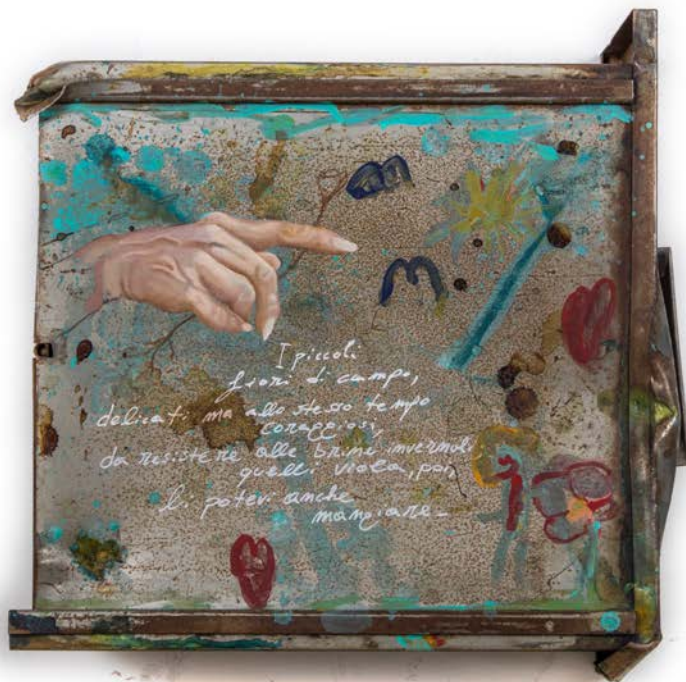
Olio e acrilico su metallo 43x43x17,5 cm + video proiezione,2019 Vimeo : https://vimeo.com/436786667