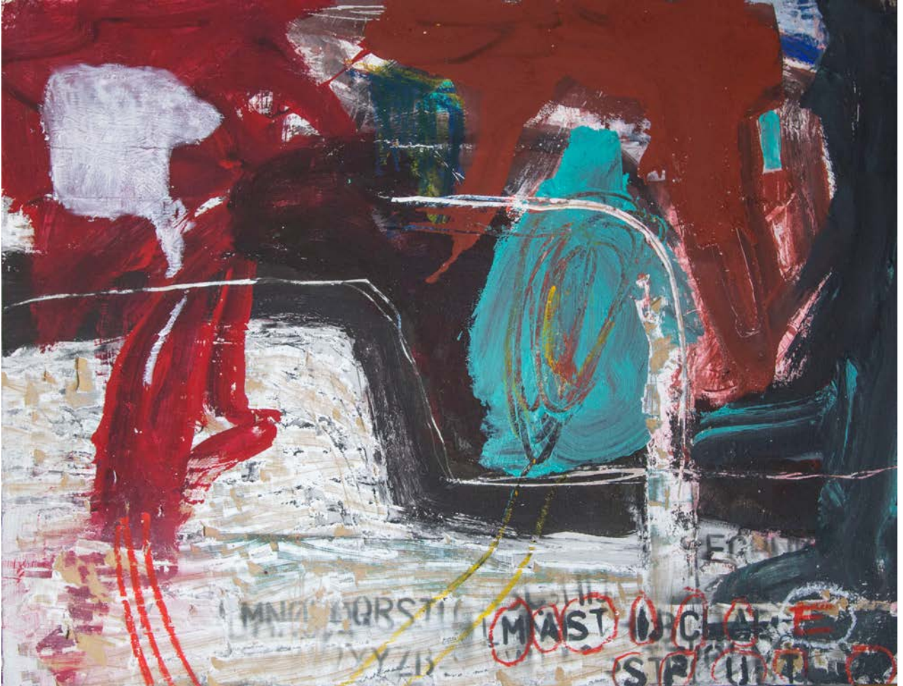
"Untitled" Vernice industriale, acrilico, olio, spray su mdf , 80x100 cm , Roma 2020