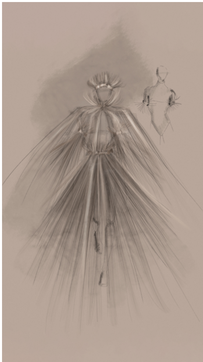
Bozzetto costume per Cirque du Soleil - Federica Pochini