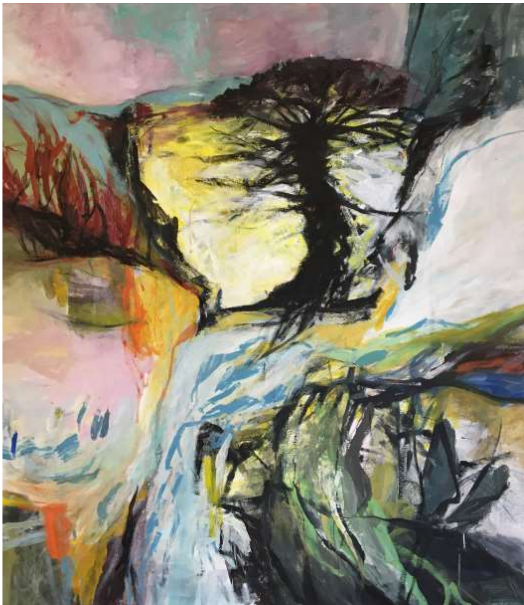
Un giorno 2021 Tecnica mista su tela 105 x 90 cm