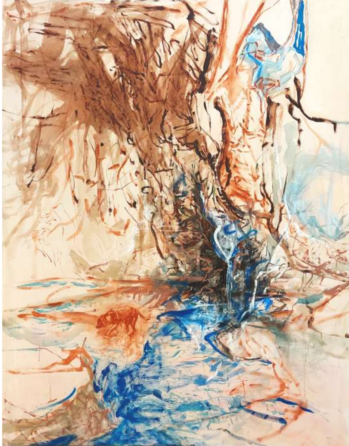
Fiuto la bestia 2023 Olio, acrilico, spray acrilico su tela 180 x 150 cm