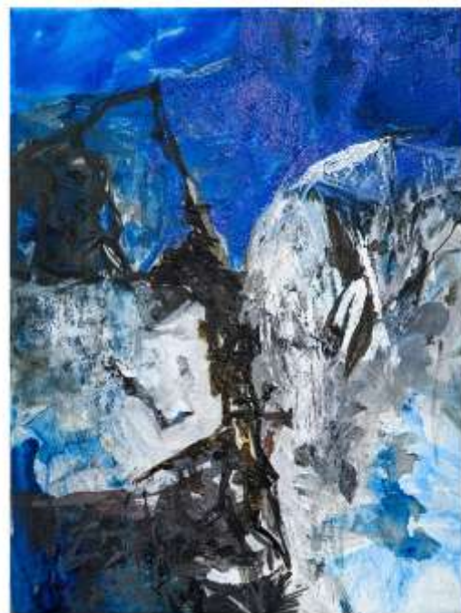
La foresta è l'animale 4 - 5 - 6 2023 Tecnica mista su tela 40 x 30 cm