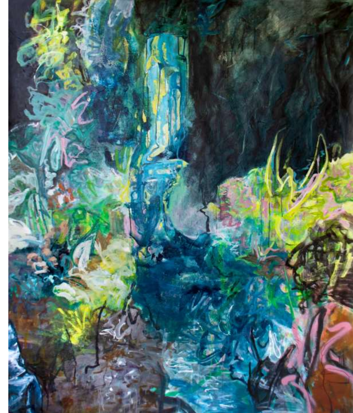
Lontano (emersione) II 2022 Tecnica mista su tela 165 x 130 cm