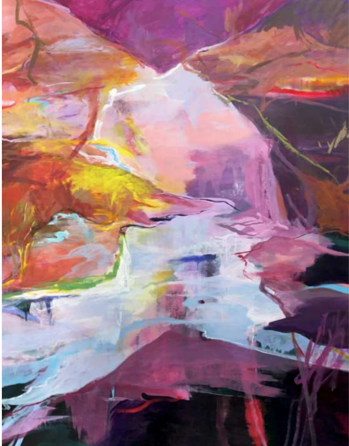
Lontano (emersione) 2022 Tecnica mista su tela 175 x 135 cm