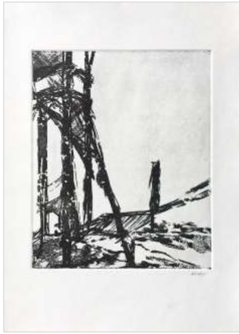
Scavi 2022 Acquatinta su zinco 35 x 25 cm