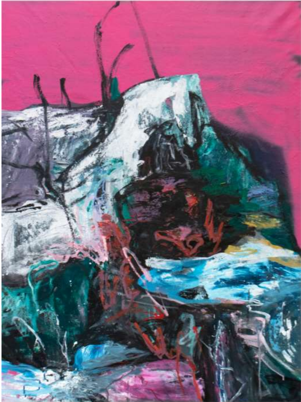
Giardino (tracce) I 2023 Tecnica mista su tela 120 x 90 cm