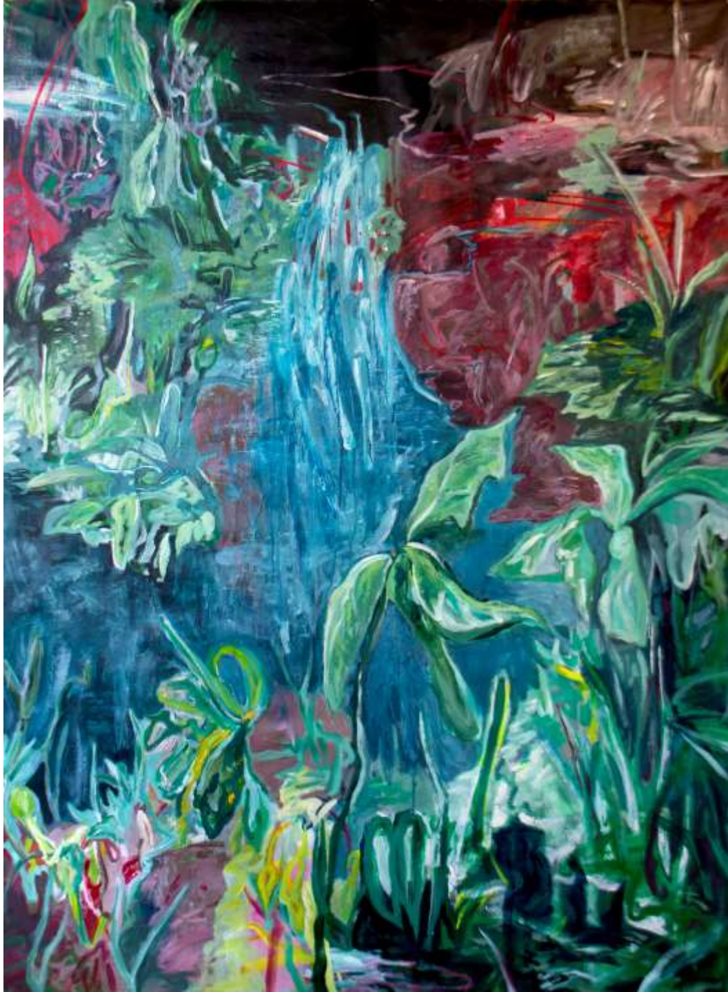
Lontano (emersione) I 2022 Tecnica mista su tela 160 x 115 cm