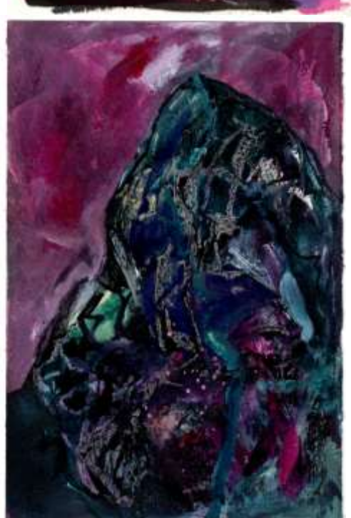
Frammenti di bosco (studi) 2023 Tecnica mista su carta 21 x 15 cm