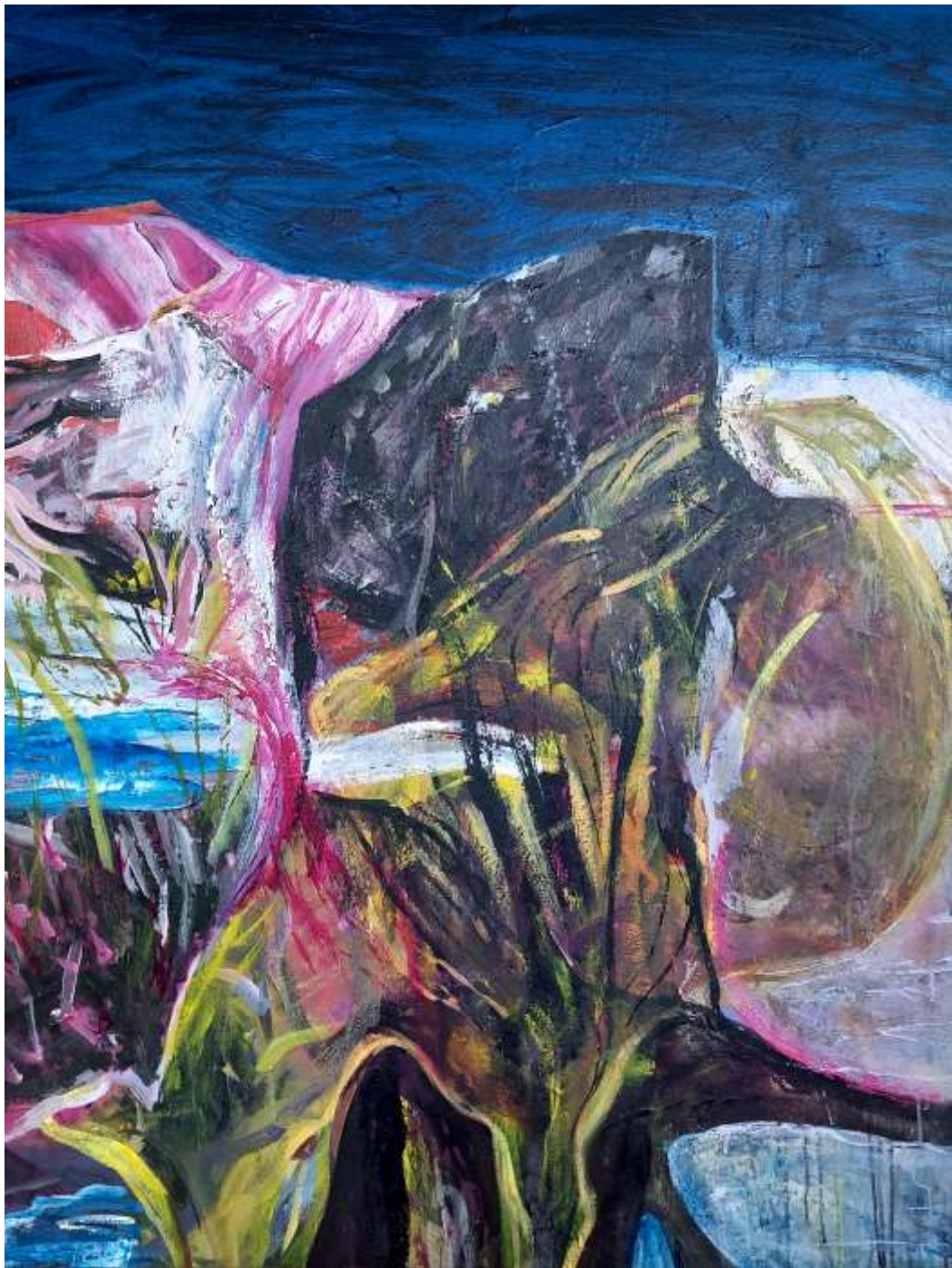
Giardino (tracce) II 2023 Tecnica mista su tela 120 x 90 cm