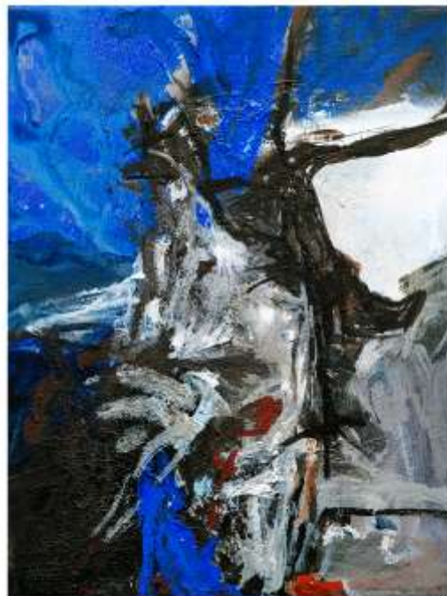
La foresta è l'animale 1 - 2 - 3 2023 Tecnica mista su tela 40 x 30 cm