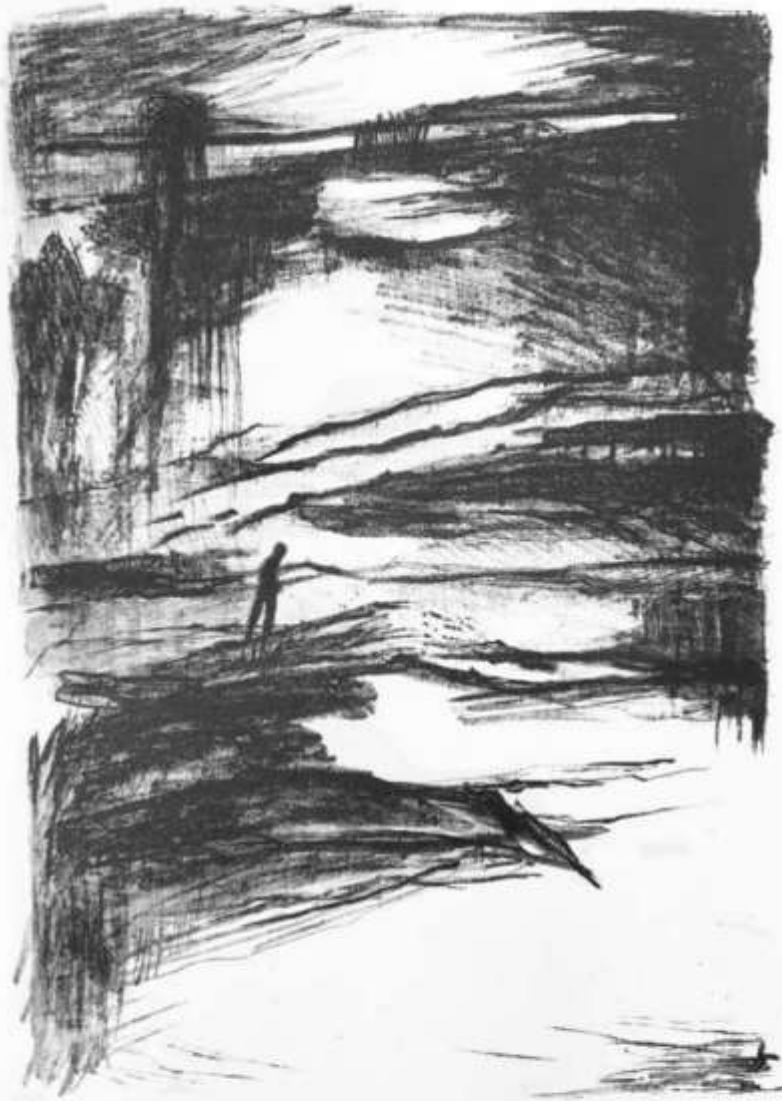
Non sogno altro che un angolo 2022 Litografia 50 x 35 cm