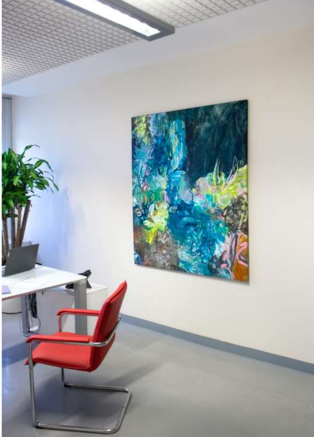
Lontano (emersione) II Installation view presso Ambiente spa, Roma