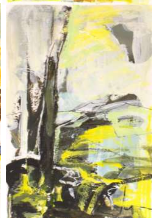
Masse e articolazioni naturali (studi) 2023 Tecnica mista su carta 21 x 15 cm